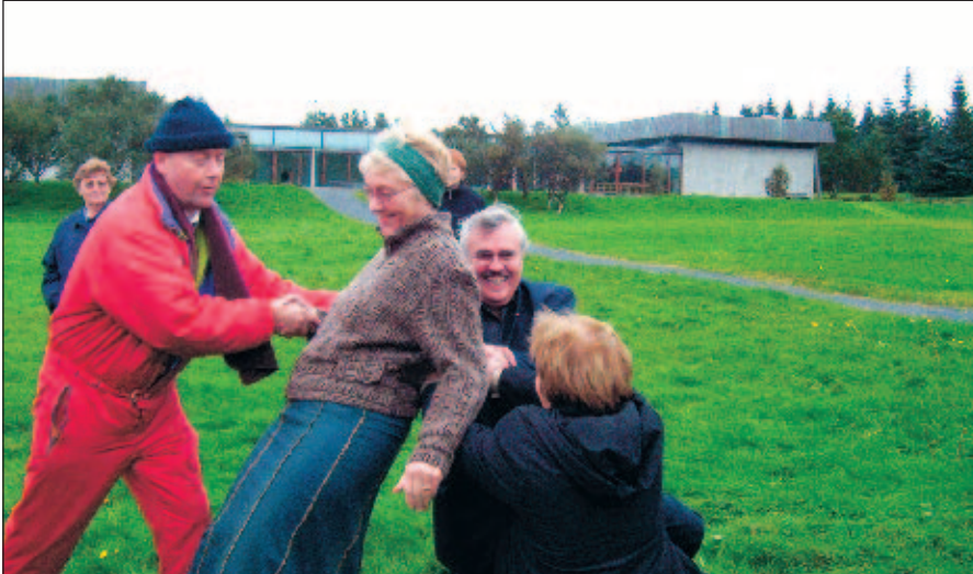
Getur Gréta treyst formanni og varaformanni? Frá námskeiðinu á Klambratúni.