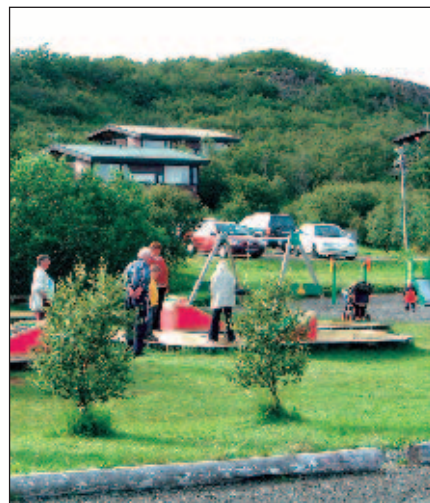
Orlofsíbúðir PFÍ og húsin í Munaðarnesi eru leigð út allt árið.

Töluvert er um að þeir sem dvelja í húsum félagsins geri athugasemdir við búnað og ástand húsanna. Að sjálf-