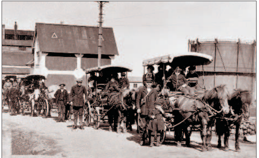
Póstlest að leggja af stað frá Hlemmi í Reykjavík við upphaf aldarinnar. .

12. maí átti stjórn félagsins með sér fund í pósthúsinu, aðallega til að skipta með sér verkum. Sú verkaskipting varð þannig að Þorleifur tók að sér að vera