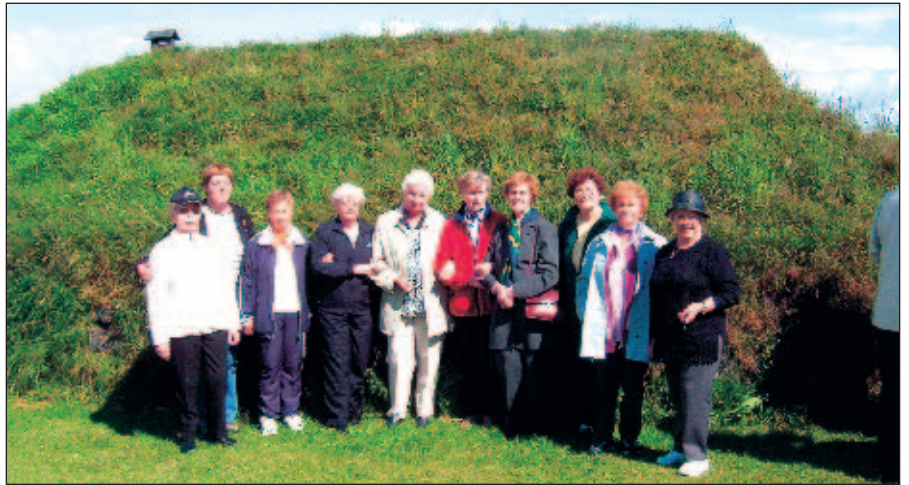
Fyrirum starfsmenn Póstgíró, fyrir utan þuríðarbúð á Eyrarbakka.

Í boði Póstmannafélags Íslands er á hverju ári farin sumarferð eftirlaunadeildar PFÍ. Þetta eru dagsferðir, vel skipulagðar og alltaf góðir leiðsögumenn með í för. Það er okkur mikils virði að hittast, rifja upp gamlar og góðar samverustundir og njóta þess að aka um landið okkar fagra. Veðrið er auðvitað misjafnt enda alltaf erfitt að stýra því en í minningunni eru þetta alltaf sólskinsferðir. Ferðunum lýkur alltaf með glæsilegum kvöldverði í boði