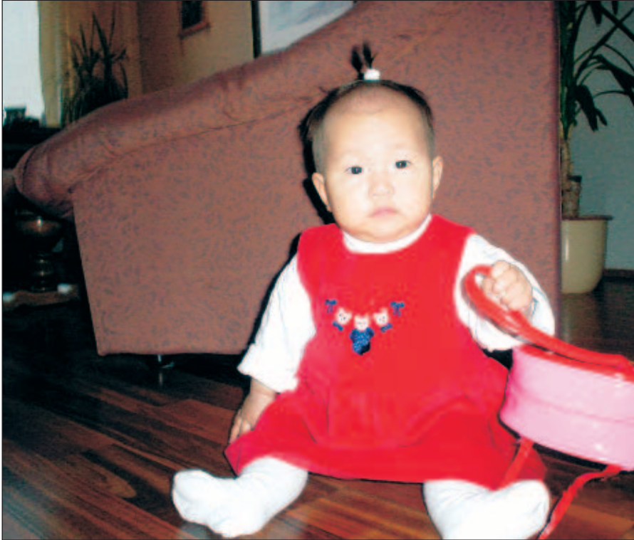
Nýi Íslendingurinn kominn heim til pabba og mömmu á Húsavík.